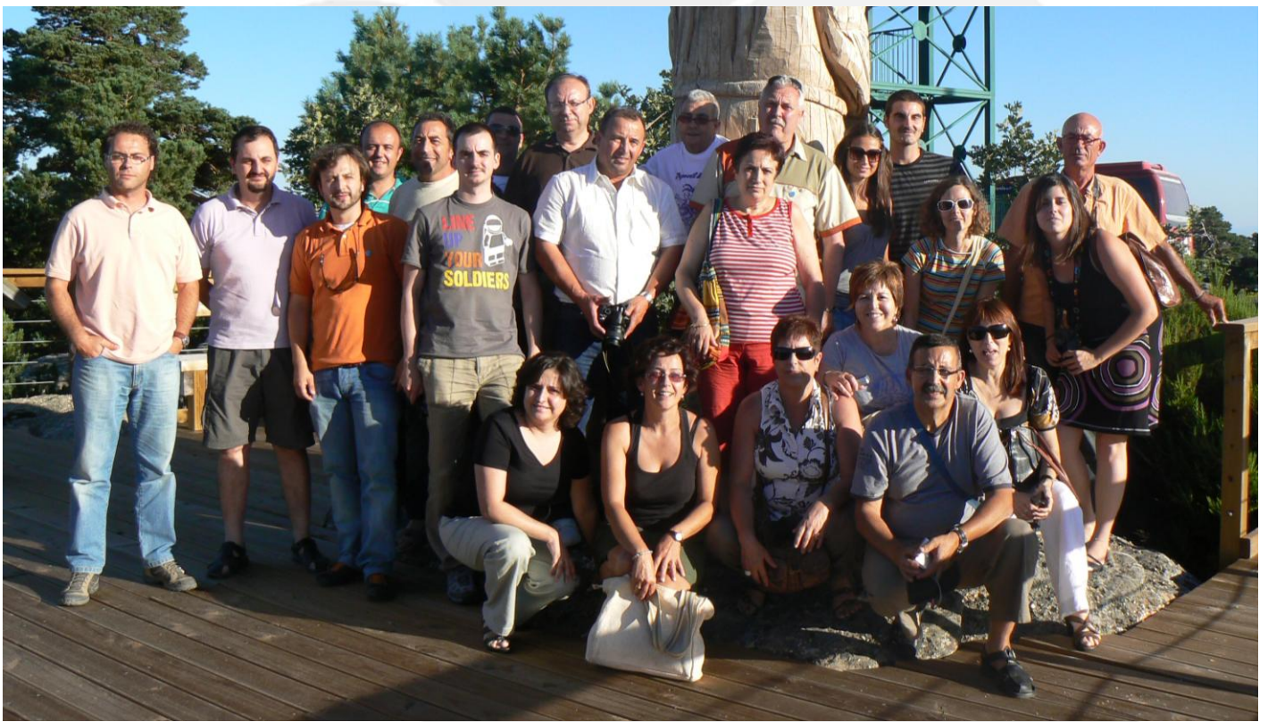
Delegación de Murcia.