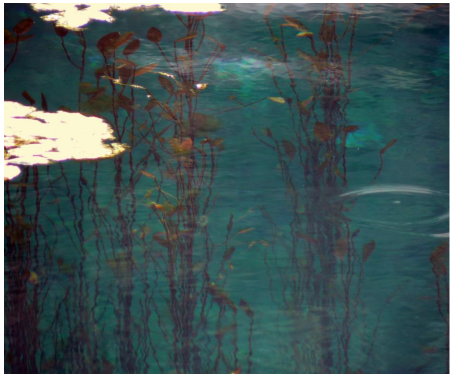
Fotografía: La Fuentona. Asociación Monte Modelo Urbión.

La nota de color la pone el Grupo de Pinares Soria – Burgos que, en el seno de la Asociación Monte Modelo Urbión, realizarán la primera etapa de un viaje que durará 4 años y que recorrerá el camino del destierro, tras las huellas de El Cid.