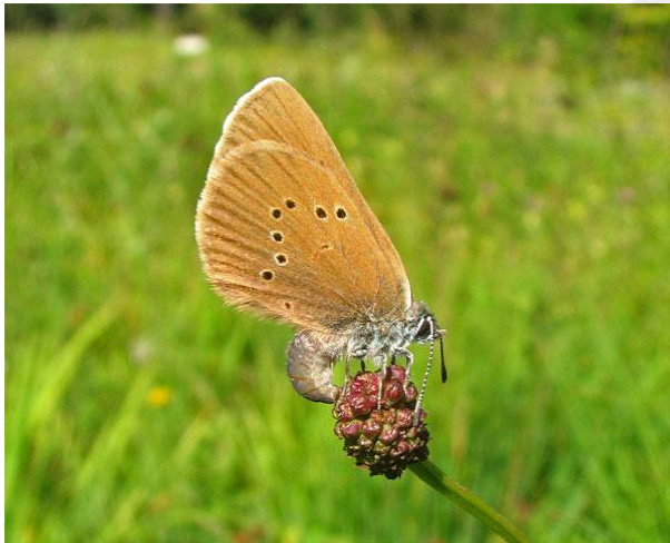
Maculinea nausithous haciendo la puesta sobre una flor de Sanguisorba officinalis .

La Maculinea nausithous , también conocida como la "hormiguera oscura" es una mariposa de gran tamaño (puede alcanzar los 36 mm de envergadura). El macho tiene el anverso de las alas de color azul oscuro (marrón oscuro en la hembra) con manchas negras y el reverso es marrón claro también punteado en ambos sexos.